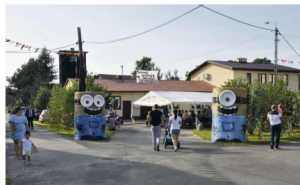
Stawy Monowskiej.