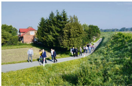
Samorządowcy na ulicy Białej w Dworach Drugich.

W Dworach Drugich "objazdowy" autobus zatrzymał się przy ulicy Białej, która prócz napraw wymaga najpierw uregulowania stanu prawnego. Sołtys Stanisław Nowotarski zwrócił też uwagę na ulicę Suchobudzie i sfaldowany asfalt na łuku Oświęcimskiej, która jest