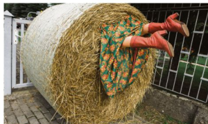
Poręba Wielka.