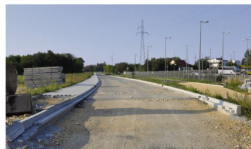
Budowa drogi odłączającej stanęła latem.

Prowadzone przez portal Fakty Oświęcim.pl dziennikarskie śle-