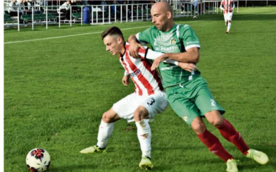
Pilkarski beniaminek z Rajska zdobył cenny punkt w pojedynku z czwartoligowym liderem, czyli rezerwami Cracovii.