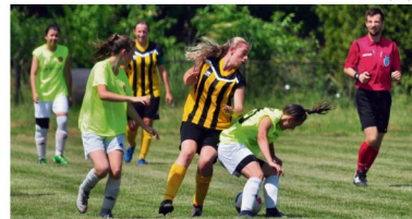
Zwycięstwo, remis i porażka - taki jest dotychczasowy dorobek drugoligowych piłkarek KKPNI Iskry Brzezinka w tym sezonie.