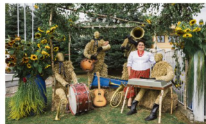
Poręba Wielka.