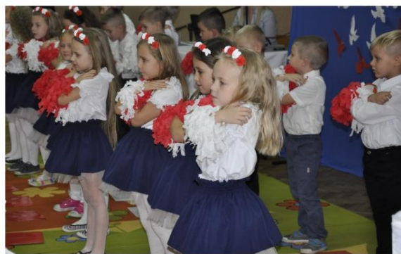
Wieczornica przedszkolaków z Brzezinki.

sienicy, Rajsku, Harmężach, Porębie Wielkiej, Babicach i Brzezince.