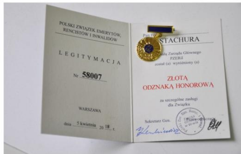
Liderka emerytów z Włosienicy została wyróżniona Złotą Odznaką Honorową.