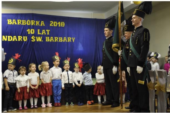
Włosienica.