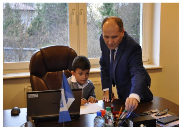
Specjalny wniosek-zarządzenie na biurku wójta.