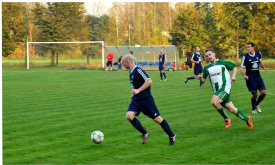
Przed inauguracją rundy rewanżowej drużyna z Rajksa rozegra przynajmniej sześć gier kontrolnych.