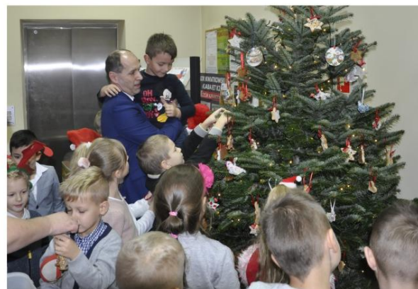
Dekorowanie drzewka w Urzędzie Gminy. Fot. LCh

Przedszkolacy z Brzezinki odwiedzili Urząd Gminy 10 grudnia, żeby złożyć życzenia pracownikom i przystroić choinkę.