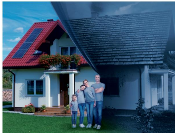
Materiał Narodowego Funduszu Ochrony Środowiska i Gospodarki Wodnej.

Celem wprowadzenia uchwały antysmogowej jest poprawa stanu powietrza w naszym regionie. Wpłyne to, jak już wyżej wskazano, na wszystkich mieszkańców Małopolski. Oddychanie zanieczyszczonym powietrzem zwiększa ryzyko wielu chorób, w tym zawału serca, udaru mózgu, nadciśnienia, nowotworów, zaostrzenia astmy, bezpłodności, przewlekłej obturacyjnej choroby płuc. W naszej Gminie stan powietrza jest bardzo zły, co można było zaobserwować śledząc pomiary pyłomierza w Babicach, wypożyczonego Gminie Oświęcim przez Krakowski Alarm Smogowy w dniach 5-26 listopada 2018 r.