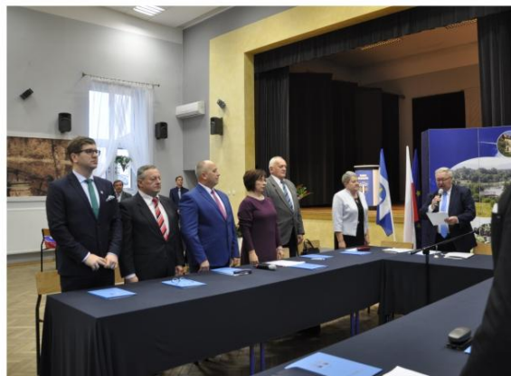
Ślubowanie radnych Gminy Oświęcim.