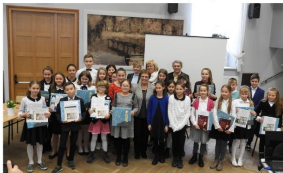
Konkurs pięknego czytania.