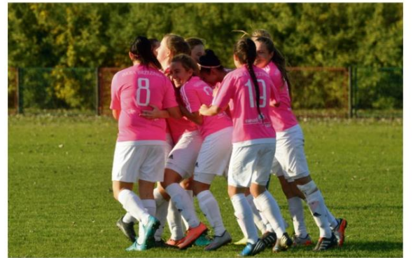
Seniorki Iskry Brzezinka imponowały jesienią na zielonych boiskach i po pierwszej rundzie są liderkami trzeciej ligi. Jak będą radziły sobie w hali?

W grupie młodziczek (rocznik 2008-2006) do finałów awansują zwycięzynie grup eliminacyjnych oraz dwie najlepsze drużyny z drugich miejsc. Iskra (grupa C) rywalizować będzie z UKS-em Jedyńka Krzeszowice, Starówką Nowy Sącz, Wisłą Brzezinka i Prądniczanką Kraków. Z kolei wśród orliczek (rocznik 2008 i młodsze)