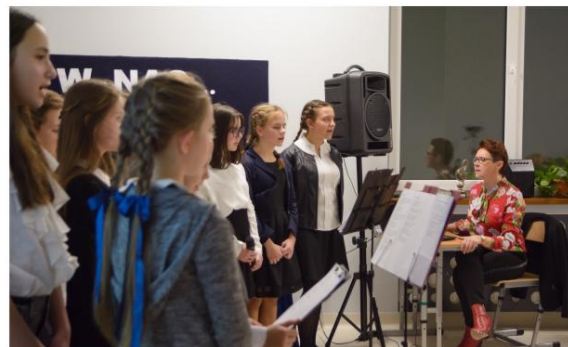
Wieczornica w Porębie Wielkiej.